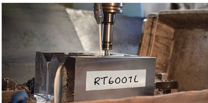
機械設備への貼付メモ用として