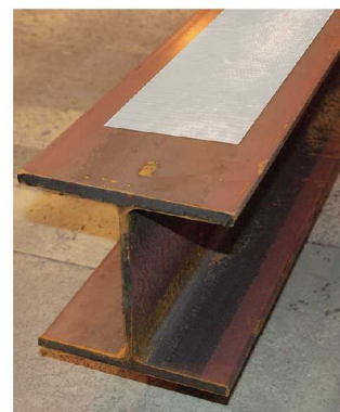
鉄部材への貼付用として