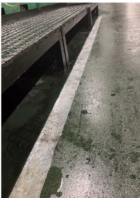
工場内でのラインテープとして

油の付いた面への貼付に。 様々なシーンに合わせてテープ色（白/黄）をお選び頂けます。