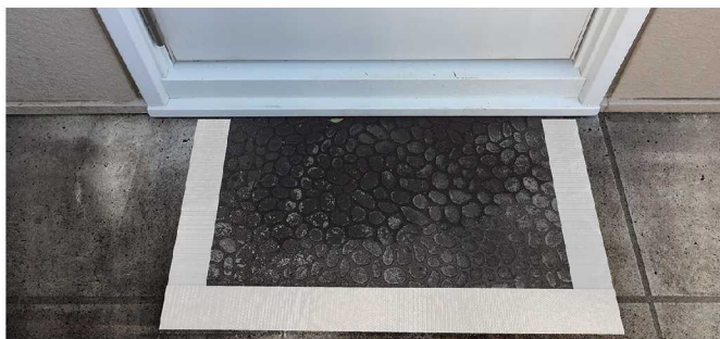
マット等の固定用として