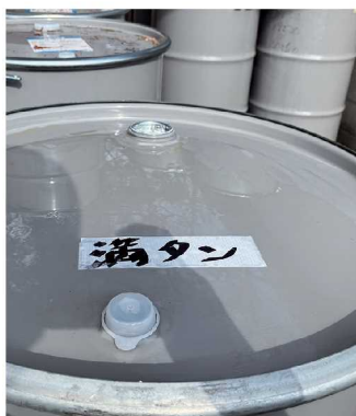
ドラム缶への貼付用として