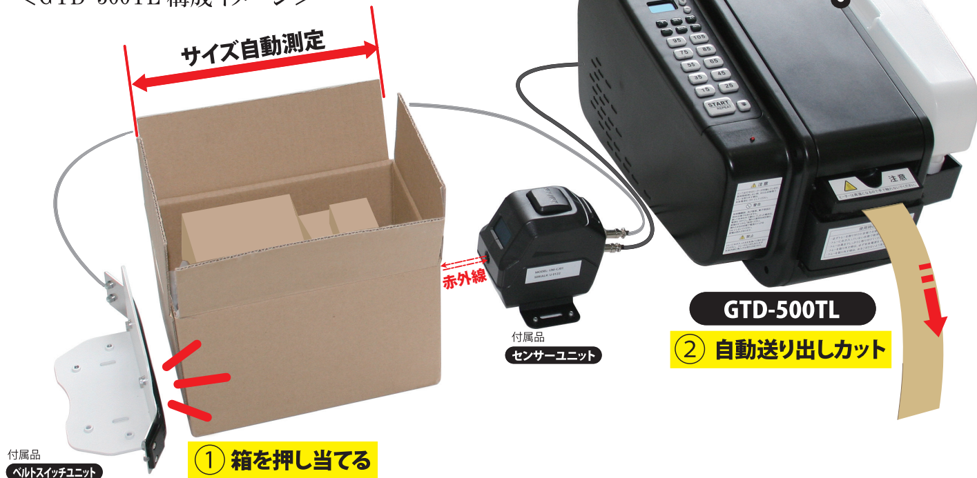
付属品 ベルトスイッチユニット