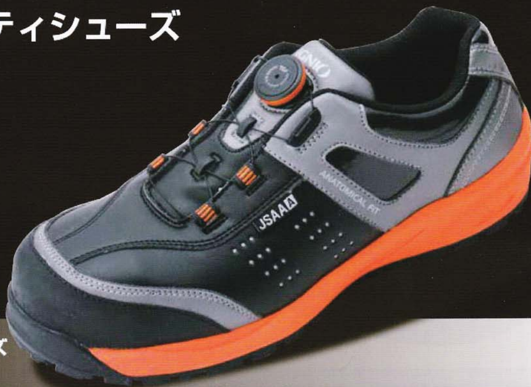
ブラック×オレンジ